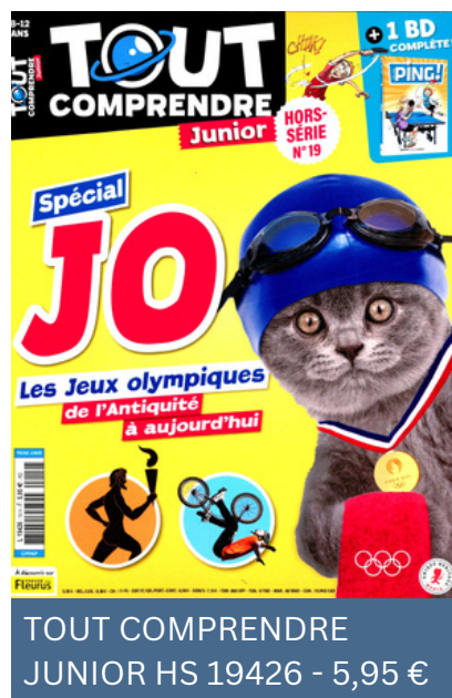
TOUT COMPRENDRE JUNIOR HS 19426 - 5,95 €