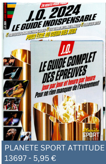
PLANETE SPORT ATTITUDE 13697 - 5,95 €