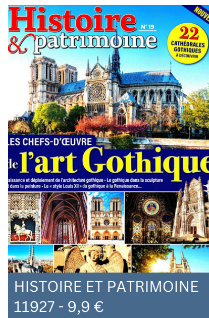
HISTOIRE ET PATRIMOINE 11927 - 9,9 €