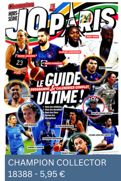
CHAMPION COLLECTOR 18388 - 5,95 €