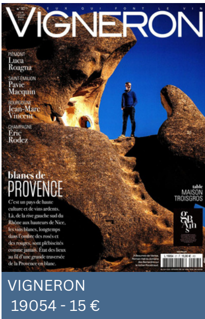
VIGNERON 19054 - 15 €

La presse magazine permet de comparer les offres autour du vin, à travers une sélection variée. L'occasion pour les connaisseurs comme pour les amateurs de dénicher quelques pépites, y compris parmi les vins écoresponsables.