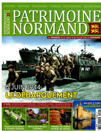
PATRIMOINE NORMAND 19844 - 10 €