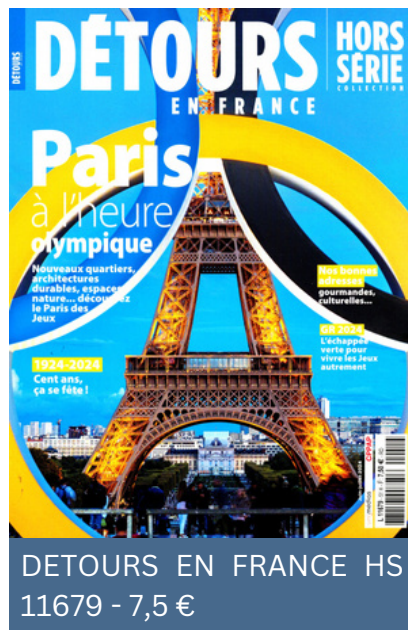
DETOURS EN FRANCE HS 11679 - 7,5 €