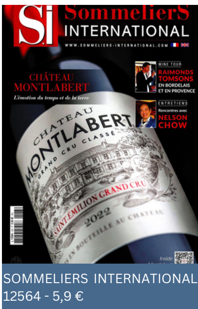
SOMMELIERS INTERNATIONAL 12564 - 5,9 €