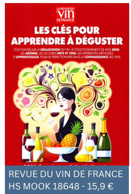
REVUE DU VIN DE FRANCE HS MOOK 18648 - 15,9 €