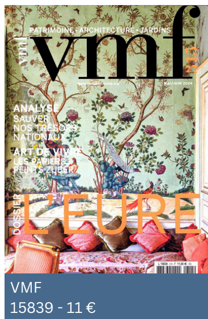
VMF 15839 - 11 €