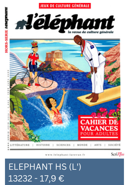
ELEPHANT HS (L') 13232 - 17,9 €