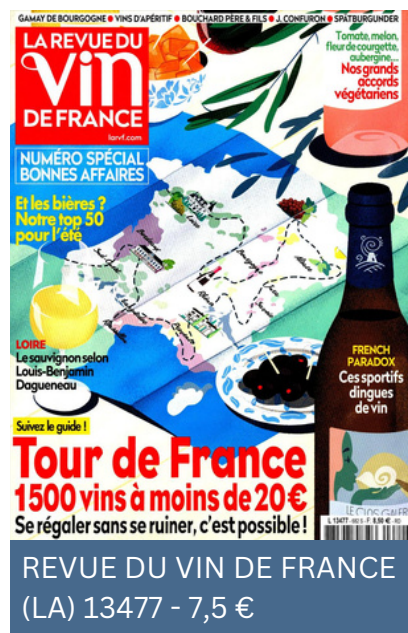
REVUE DU VIN DE FRANCE (LA) 13477 - 7,5 €