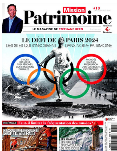
MISSION PATRIMOINE 16939 - 5,9 €

Les journées du patrimoine, évènement annuel culturel phare, permettent de visiter le patrimoine national dans toute la France, dans des monuments ou des lieux insolites exceptionnellement ouverts au public.