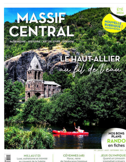
MASSIF CENTRAL PATRIMOINE 11898 - 9,9 €