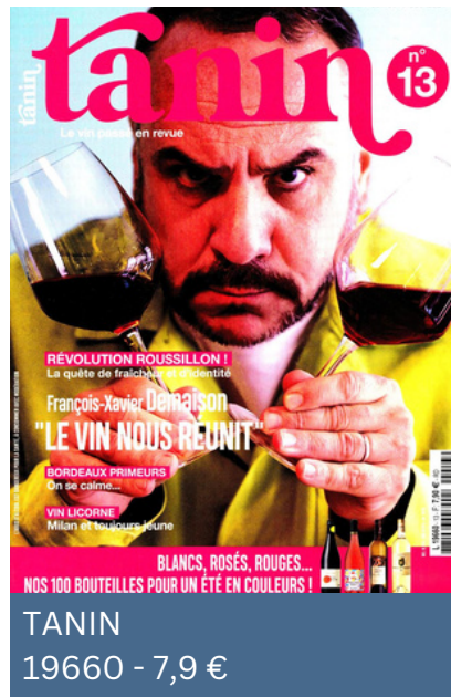
TANIN 19660 - 7,9 €