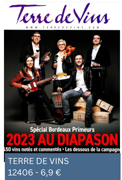
TERRE DE VINS 12406 - 6,9 €