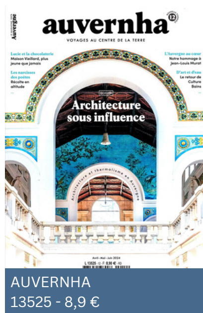
AUVERNHA 13525 - 8,9 €