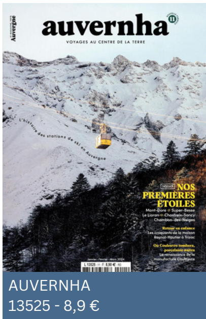
AUVERNHA 13525 - 8,9 €

Avec 2 week-ends de 3 jours et un pont de 5 jours, le mois de mai est propice aux projets pour explorer nos régions et destinations européennes de proximité. Une presse à mettre en avant dès à présent pour passer à l'action.