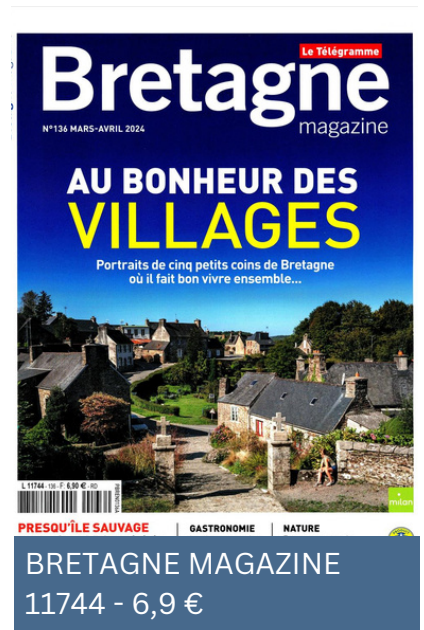
BRETAGNE MAGAZINE 11744 - 6,9 €