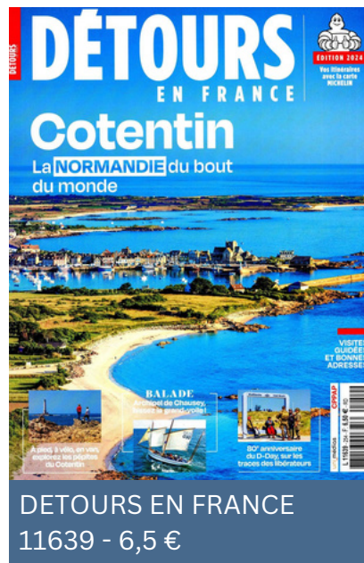
DETOURS EN FRANCE 11639 - 6,5 €