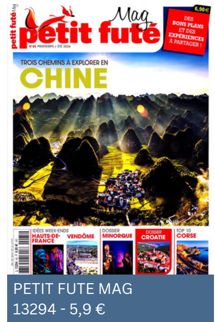
PETIT FUTE MAG 13294 - 5,9 €