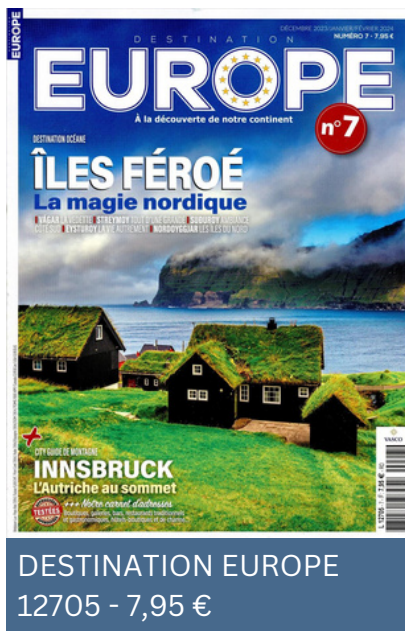
DESTINATION EUROPE 12705 - 7,95 €