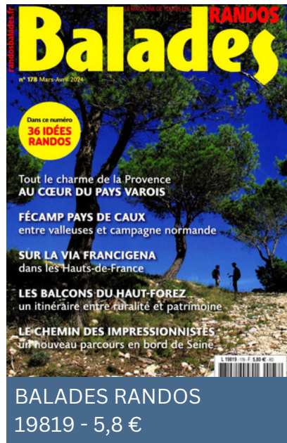
BALADES RANDOS 19819 - 5,8 €